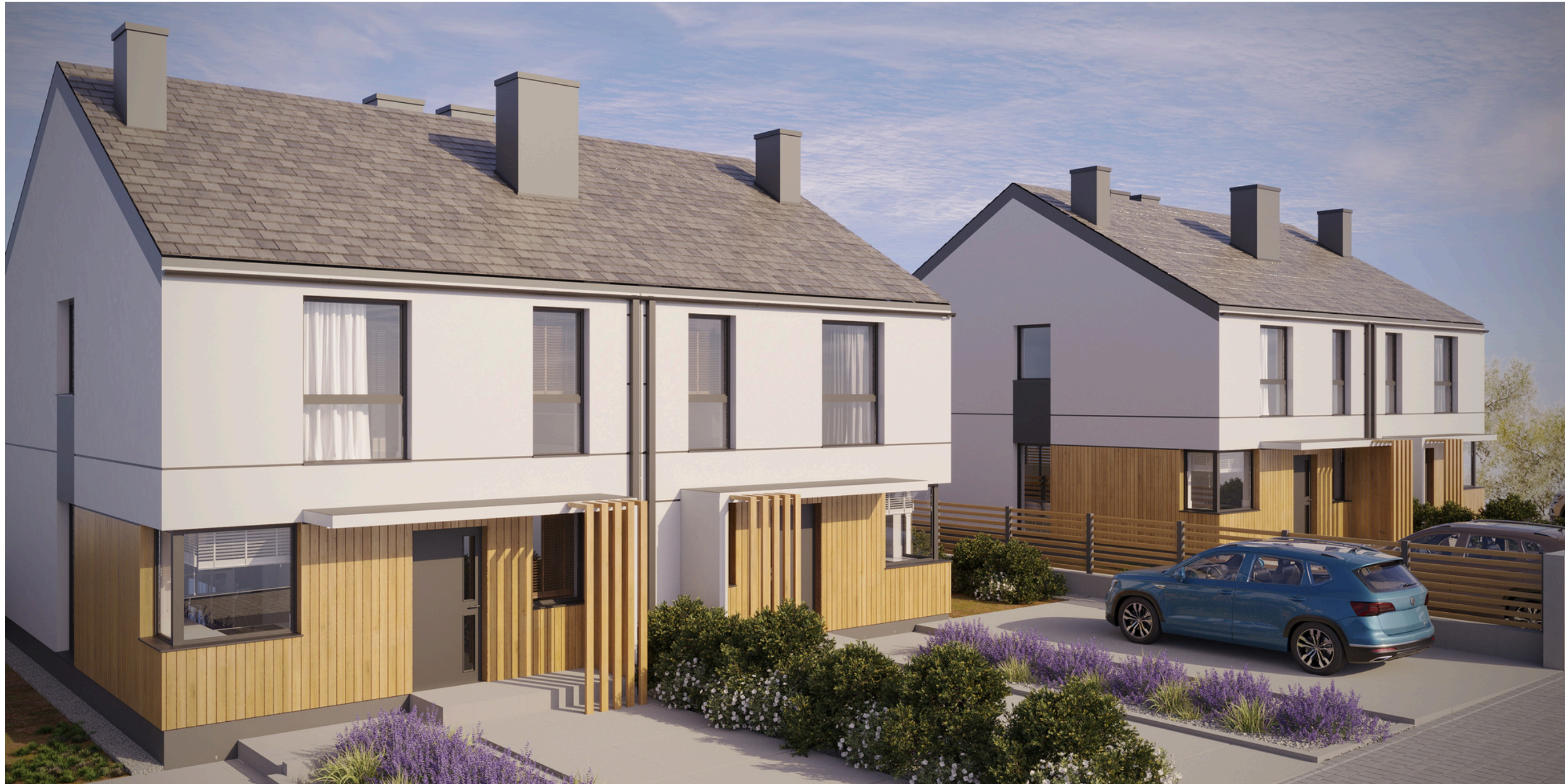
BUDYNEK B MIESZKANIE 1