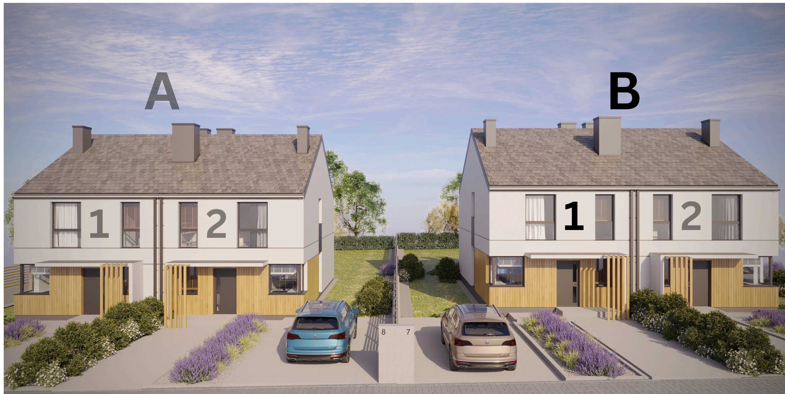
BUDYNEK B MIESZKANIE 1